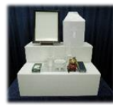
後飾り祭壇・仏具