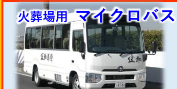
火葬場用 マイクロバス